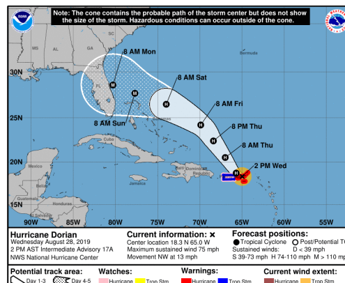
Figura 2. Cono de pronóstico de trayectoria huracán DORIAN.

De acuerdo con el NCH (National Hurricane Center), se prevé que el Huracán DORIAN se mueva en dirección noroeste, ingresando nuevamente al océano Atlántico en cercanía de las Islas Vírgenes Estadounidenses y Británicas (Ver figura 2).